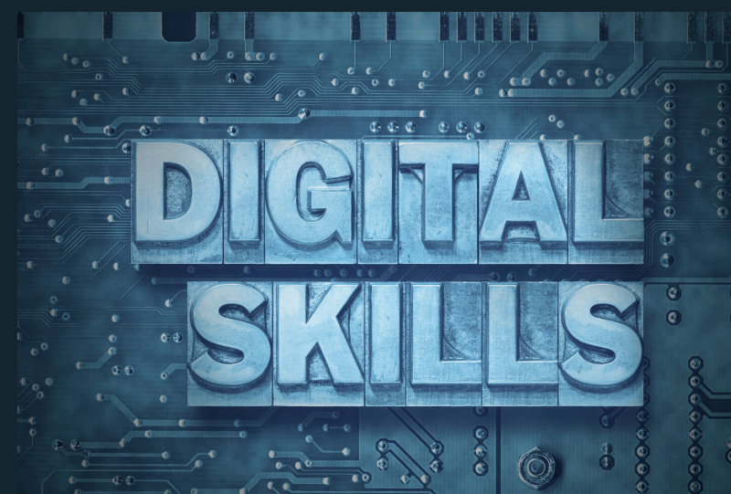
Минимално поседување на дигитални вештини